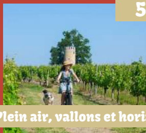
Plein air, vallons et horizons