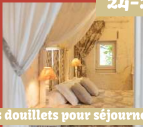
Nids douilletts pour séjourner ...