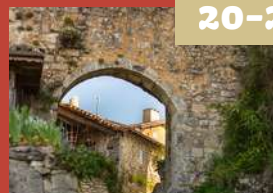
Chemins vagabonds du patrimoine