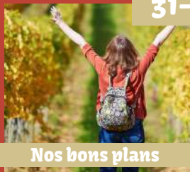
Nos bons plans