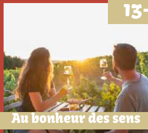
Au bonheur des sens